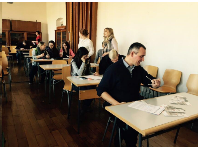
Eure Klasse GK 15b

Die Azubis der GK 15 b haben am 09.03.2016 eine eigenständig organisierte DKMS-Typisierungsaktion am Standort Röhrstraße in Anlehnung an die Aktion der Projektwoche am Rathenauplatz durchgeführt. Es war für mich wieder eine verblüffende Erfahrung, erleben zu dürfen, mit welchem Engagement unsere Azubis "zu Werke gehen". Gern hab ich sie dabei unterstützt. :-)